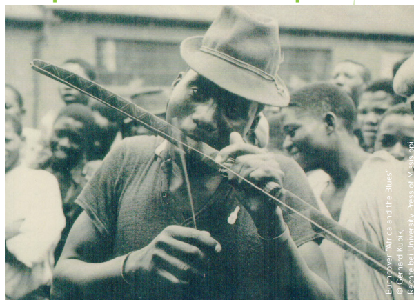
Blugroover "Africa and the Blues" © Gerhard Kubik, Rechte bei University Press of Mississippi