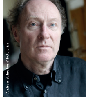
Andreas Schreiber

Freiheit und Improvisation gehören nah zusammen, und sind doch in der Praxis oft weit voneinander entfernt. Worin gründet dieser Widerspruch und wie kann die Entfernung verringert oder überwunden werden?